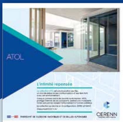
ATOL - L'intimité repensée