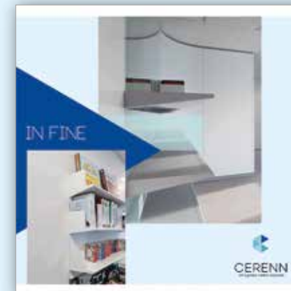
IN FINE - Les accessoires