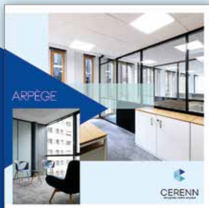
ARPÈGE - La simplicité choisie