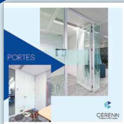
PORTES - Les portes