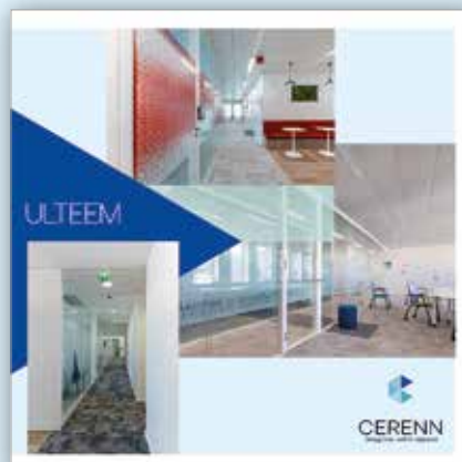
ULTEEM - La polyvalence absolue